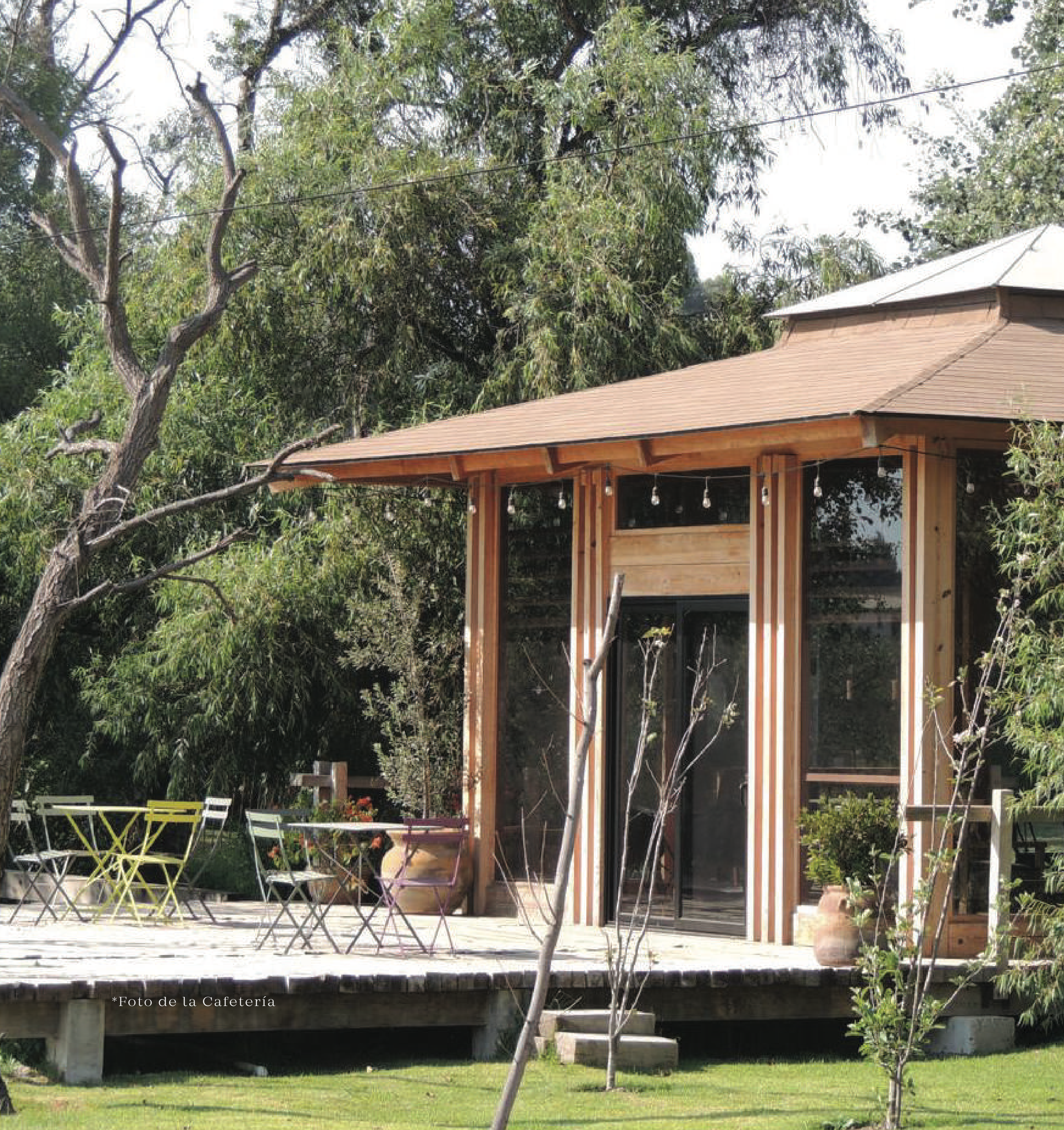
*Foto de la Cafetería